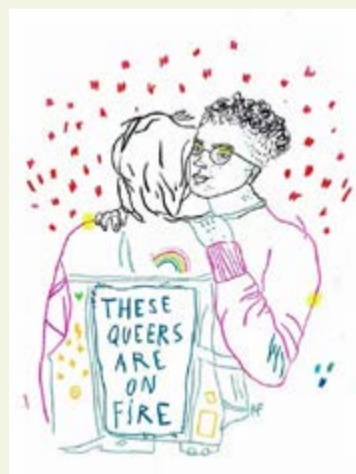
Queers on fire door Ranafarba