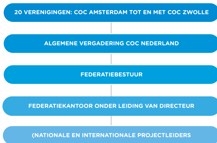
Federatie COC Nederland schematische structuur

Elke COC-vereniging heeft op de AV een aantal stemmen, dat afhangt van de grootte van de vereniging. De inbreng van onze vereniging op deze AV wordt voorbereid door ons bestuur.