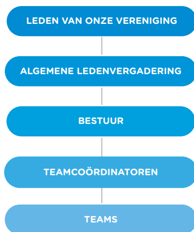
COC-verenigingen schematische structuur