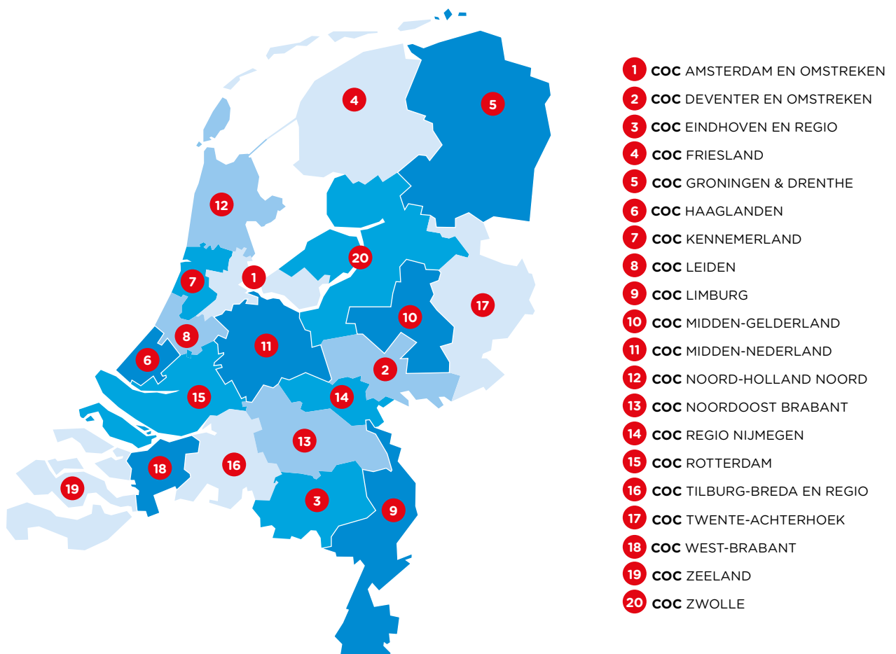
Kaart Nederland: verdeling werkgebieden

Alle twintig COC-verenigingen hebben hun eigen werkgebied. Samen bestrijken we heel Nederland. Kijk voor het werkgebied van onze vereniging op onderstaande kaart. Daar zie je ook welke 'buurverenigingen' onze vereniging heeft, waarmee je samenwerking kunt zoeken om doelen te bereiken. De verdelingen van COC-verenigingen kan je op detailniveau terugvinden via: coc.nl/gemeenten-per-coc-vereniging